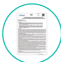
1 ulotka w języku polskim