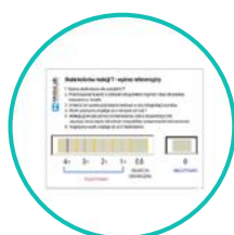
Schemat referencyjny (porównawczy) skali barw reakcji liniowej T