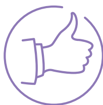
nieinwazyjny i komfortowy dla pacjentki