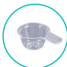
1 pojemnik na próbkę moczu