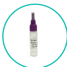
1 probówka ekstrakcyjna zawierająca 0,5 ml roztworu buforowego