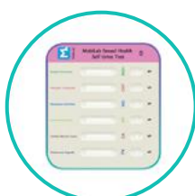
1 test zawierający kasetę testową combo 6 w 1