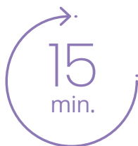
wynik w ciągu 15 minut