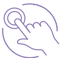
łatwy w wykonaniu

Zasada działania testu polega na jakościowym wykryciu antygenu w próbce moczu i jego wzrokowym odczycie na urządzeniu testującym – płytce testowej. Test MobiLab STI 6 w 1 należy do grupy testów szybkich. Wynik uzyskujemy w ciągu 15 minut.