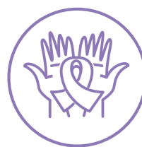
poszerza pakiet usług wczesnej diagnostyki