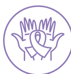
poszerza pakiet usług wczesniej diagnostyki