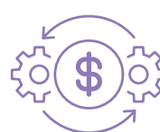
niedroga i opłacalna procedura

Test MobiLab STI 4 w 1 jest przeznaczony do diagnostyki in vitro. To jakościowo i ekonomicznie uzasadniona procedura w codziennej praktyce ginekologicznej, urologicznej i wenerologicznej. Testy są zatwierdzone przez FDA, posiadają znak CE oraz zostały zarejestrowane w Urzędzie Rejestracji Produktów Leczniczych w Polsce.