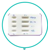
1 test zawierający kasetę testową combo 4 w 1