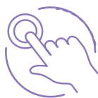
łatwy w wykonaniu

Zasada działania testu polega na jakościowym wykryciu antygenu w próbce z krwi pełnej, osocza lub surowicy i wzrokowym odczycie wyniku na urządzeniu testującym - kasetce testowej. Test MobiLab STI 4 w 1 należy do grupy testów szybkich. Wynik uzyskujemy w ciągu 15 minut.