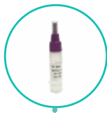
1 roztwór buforowy