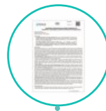
1 ulotka w języku polskim

Jedno opakowanie kartonowe zawiera 25 kasetek testowych, z których każda jest osobno zapakowana w woreczku foliowym ze środkiem osuszającym.